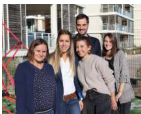
L'équipe d'Améthyste avec les services civiques